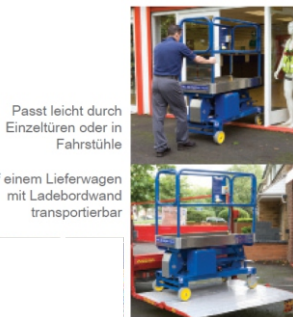
Passt leicht durch Einzeltüren oder in Fahrstühle