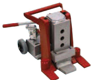
JH 15 G plus